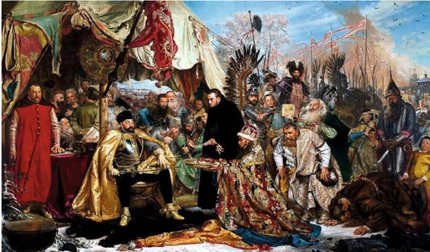
Abb. 5: Jan Matejko, Stefan Batory pod Pskowem (Stefan Batory bei Pskow), 1872, 322 x 545 cm, Königsschloss Warschau.

knirscht Andere, wie gerührt und begeistert die Edelsten, daß mans dabei unwillkürlich auch wird.“ 28