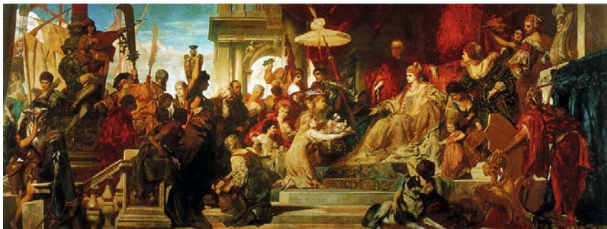
Abb. 6: Hans Makart, Venedig huldigt der Catharina Cornaro, 1873, 400 x 1060 cm, Oberes Belvedere Wien.

sein monumentales Gemälde an einem anderen Ort zu präsentieren. Zum einen macht die enorme Größe des Bildes von mehr als zehn Metern eine Ausstellung des Gemäldes in den österreichischen Sälen unmöglich, da ein angemessener Abstand zum Betrachten fehlt. Zum anderen will sich Makart gerade durch die Separierung seines Werkes von der Weltausstellung hervortun, indem sein Gemälde „zum Spitzenreiter des Ausstellungswettstreits“ 31 wird.