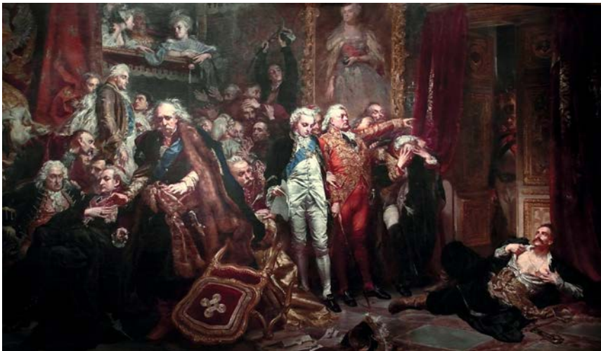
Abb. 2: Jan Matejko, Rejtan , 1866, 282 x 487 cm, Königsschloss Warschau.

das monumentale Bildnis Katharinas II. (1729–1796) im Hintergrund demonstriert, wie auch durch die Darstellung des russischen Botschafters Nikolai Wassiljewitsch Repnin (1731–1801), der in der Loge über dem Geschehen thront. Diese vermeintlich historische Darstellung der heldenhaften Tat Rejtans, der sich der Übermacht Russlands stellt, wird von Matejko durch Porträts polnischer Adliger relativiert, die, in der linken unteren Bildhälfte eingezwängt, weder Rejtan unterstützen noch das Eindringen der russischen Soldaten verhindern, sondern im Gegenteil den Abgeordneten des Saals verweisen. Dabei fügt der Künstler auch Figuren in die dargestellte Handlung ein, die nachweislich nicht am Sejm von 1773 teilnehmen, jedoch zu einem anderen historisch belegten Zeitpunkt einen Anteil an der Teilung Polens hatten. Damit kreierte Matejko ein allegorisches Bild vom Untergang Polens, indem er den polnischen Adel anprangert.