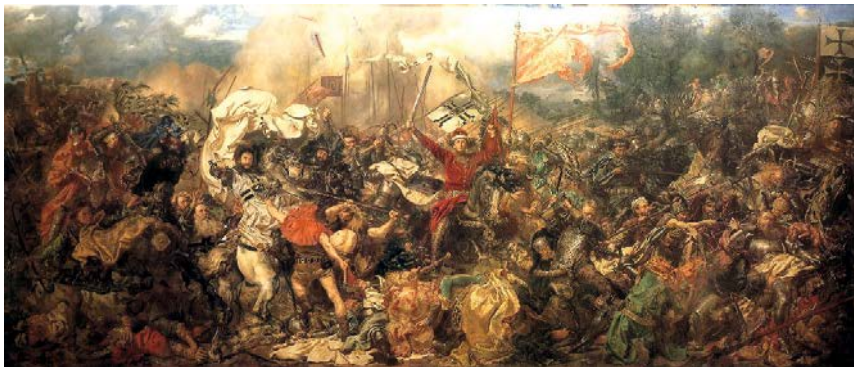
Abb. 8: Jan Matejko, Bitwa pod Grunwaldem (Schlacht von Grunwald), 1878, 426 x 987 cm, Nationalmuseum Warschau.

sich hierbei um eine Weiterführung des Themas aus der Schlacht von Grunwald 45 (Abb. 8) (1878) handelt, betont aber neben dem Thema ausdrücklich das künstlerische Können Matejkos in Bezug auf Komposition und Farbe. 46 Somit wird der polnische Künstler erstmalig nicht nur als herausragender Porträtist charakterisiert, sondern auch die Ausgewogenheit dieses Werkes hervorgehoben.