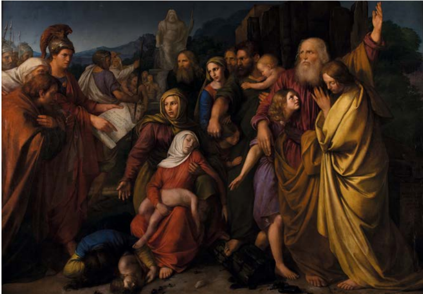
Abb. 1: Wojciech Stattler, Machabeusze (Makkabäer), 1842, 262 x 371 cm, Nationalmuseum Krakau, Pracownia Fotograficzna Muzeum Narodowego w Krakowie.

künstlerischen Impuls für seine Schüler darstellen. Des Weiteren überträgt er auf seine Schüler dogmatisch-philosophische Ansichten über die Aufgaben einer nationalen Kunst. Nach Stattlers Überzeugungen besteht eine enge Verbindung zwischen Poesie und Malerei sowie eine absolute Ergebenheit zur Philosophie. Die Kunst müsse dabei, aus einer selbstreflektierenden Beobachtung heraus, ein höheres Ziel verfolgen und sich in den Dienst der Nation stellen. 2