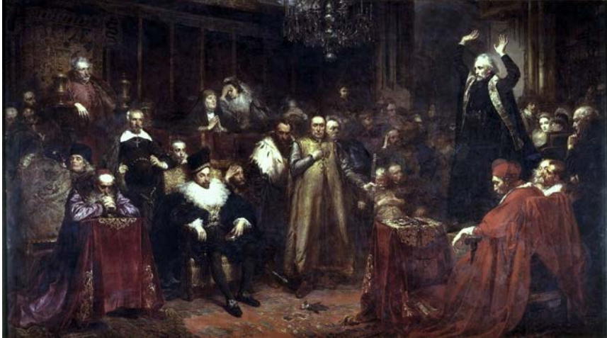
Abb. 3: Jan Matejko, Kazanie Skargi (Predigt des Skarga), 1864, 224 x 397 cm, Königsschloss Warschau.