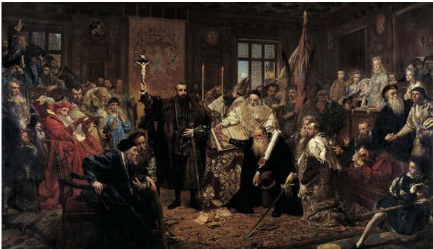
Abb. 4: Jan Matejko, Unia Lubelska (Lubliner Union), 1869, 298 x 512 cm Nationalmuseum Warschau (ausgestellt in Lublin).

tender sieht der Autor das Gemälde Predigt des Skarga an, das nach seiner Einschätzung