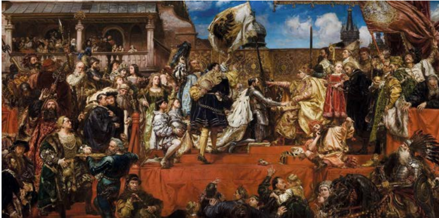
Abb. 7: Jan Matejko, Hołd pruski (Preußischer Lehnseid), 1882, 388 x 785 cm, Königsschloss Wawel, Krakau.